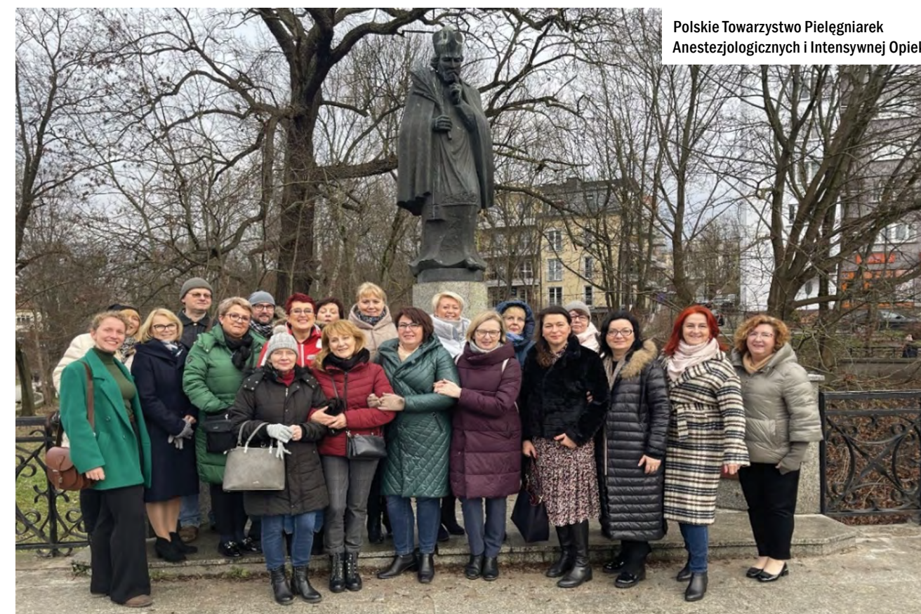
Polskie Towarzystwo Pielęgniarek Anestezjologicznych i Intensywnej Opieki

Zachęcamy wszystkich członków PTPAiO do zgłaszania własnych prac badawczych, przeglądowych, studium przypadku poprzez system rejestracji na Zjazd. Będzie istniała możliwość prezentacji prac ustnie oraz w formie plakatu. Poniżej link do rejestracji: https://med-space.pl/wydarzenie/341/xiii-zjazd-